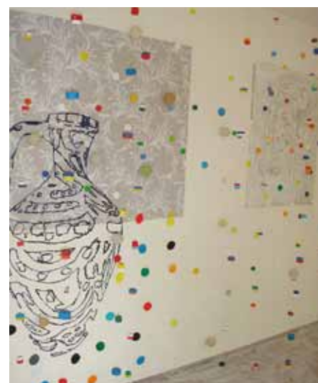
Recyclingmobile (Rod Robinson).